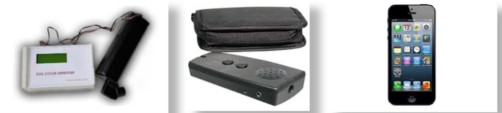
Identificador de colores