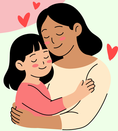
Amar en Todo Tiempo